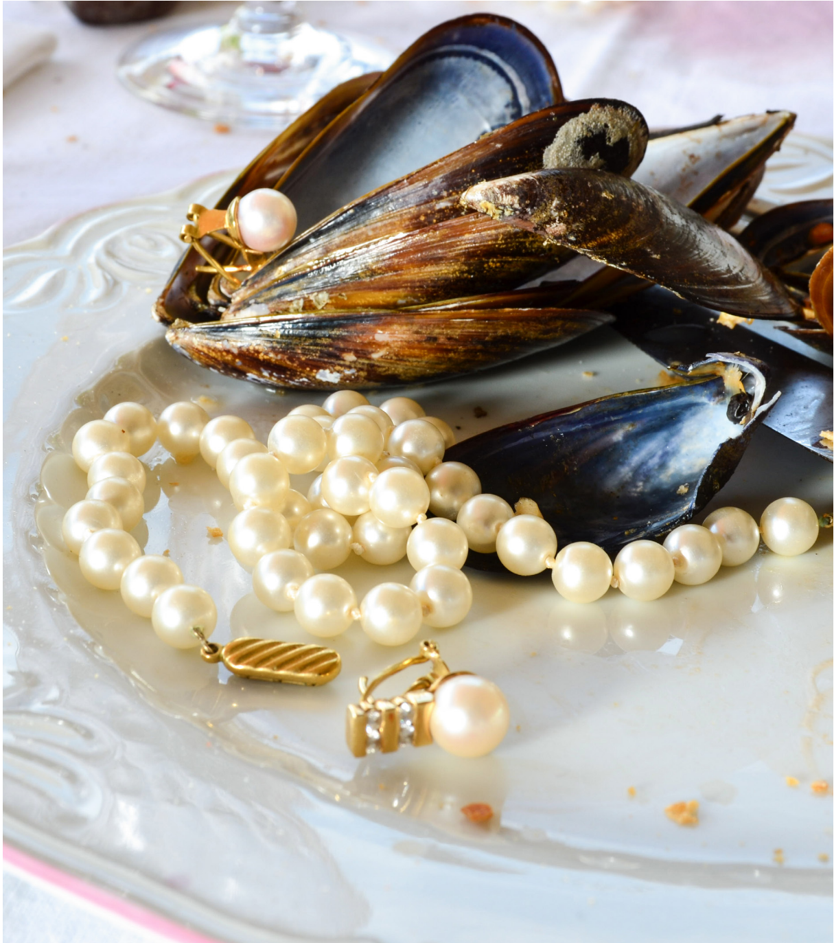
Conjunto de perlas y de oro de Lanzas .