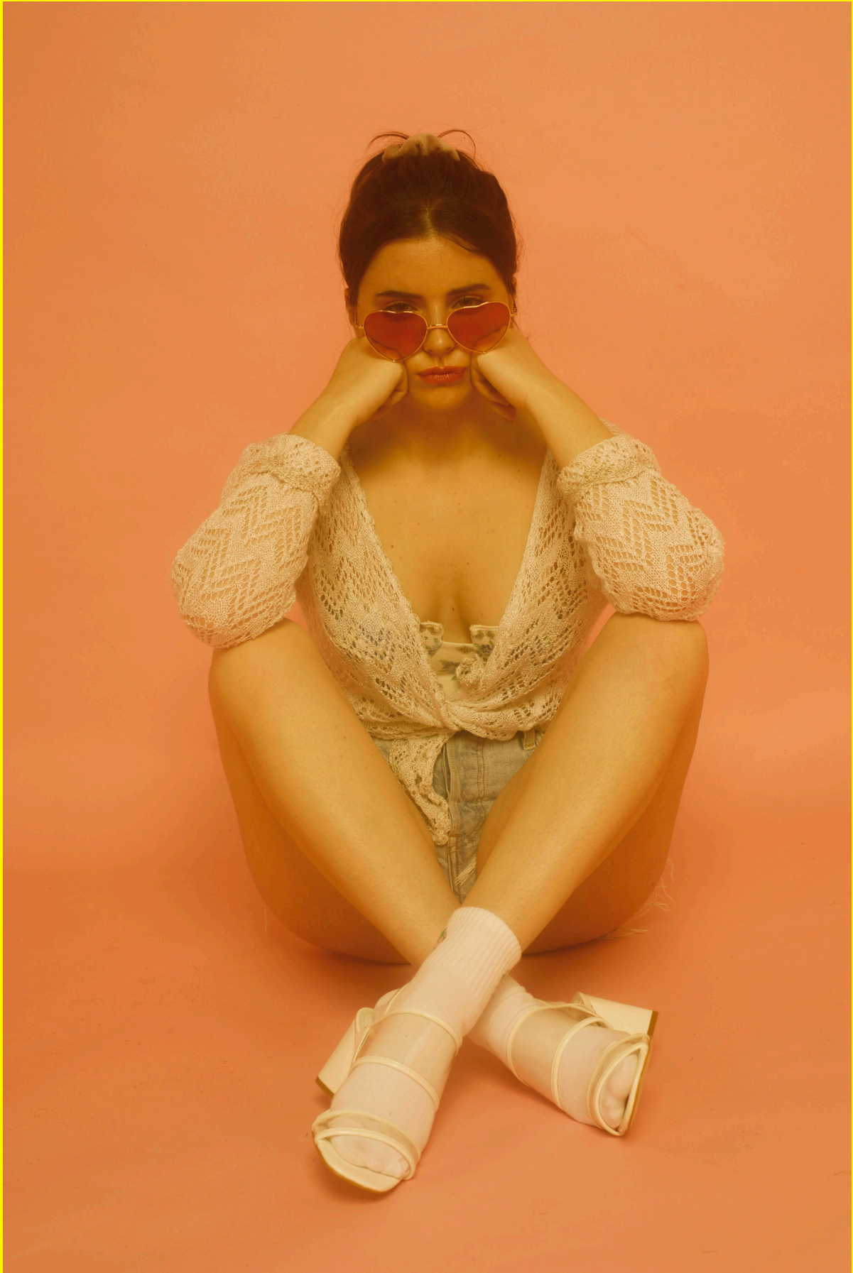
GAFAS H&M COLETERO BERSHKA CHAQUETA PODIUM BODY DONNA SHORTS LEVI'S CALCETINES BERSHKA ZAPATOS GUESS