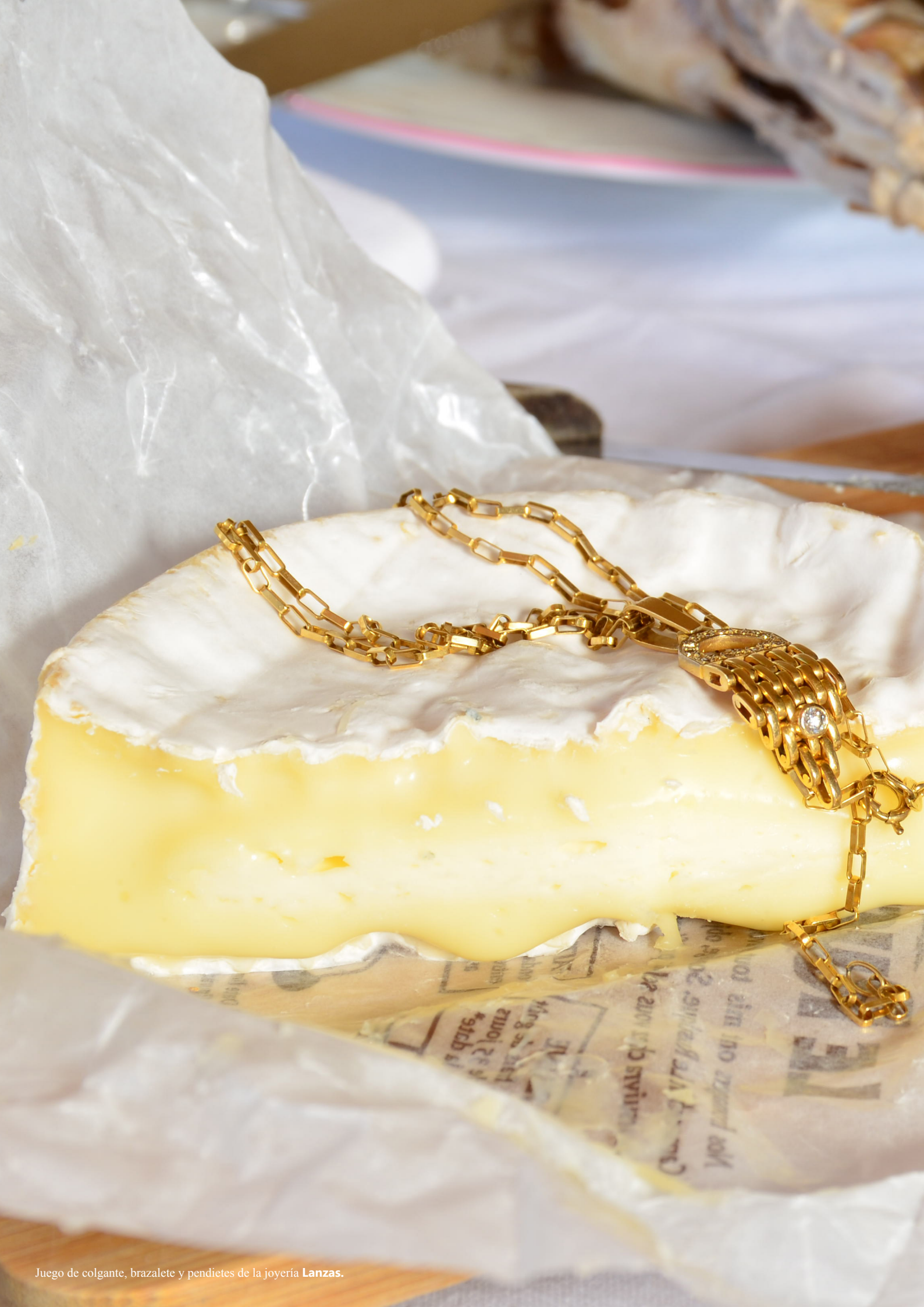
Juego de colgante, brazaletes y pendientes de la joyería Lanzas.