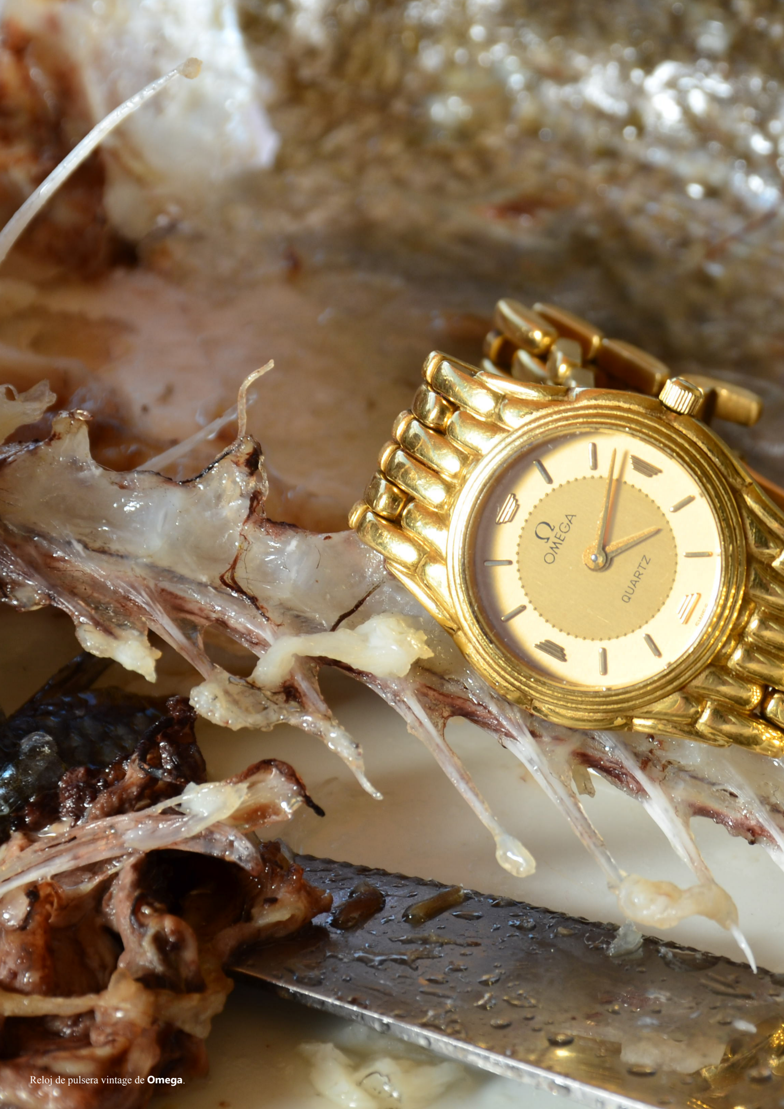
Reloj de pulsera vintage de Omega.