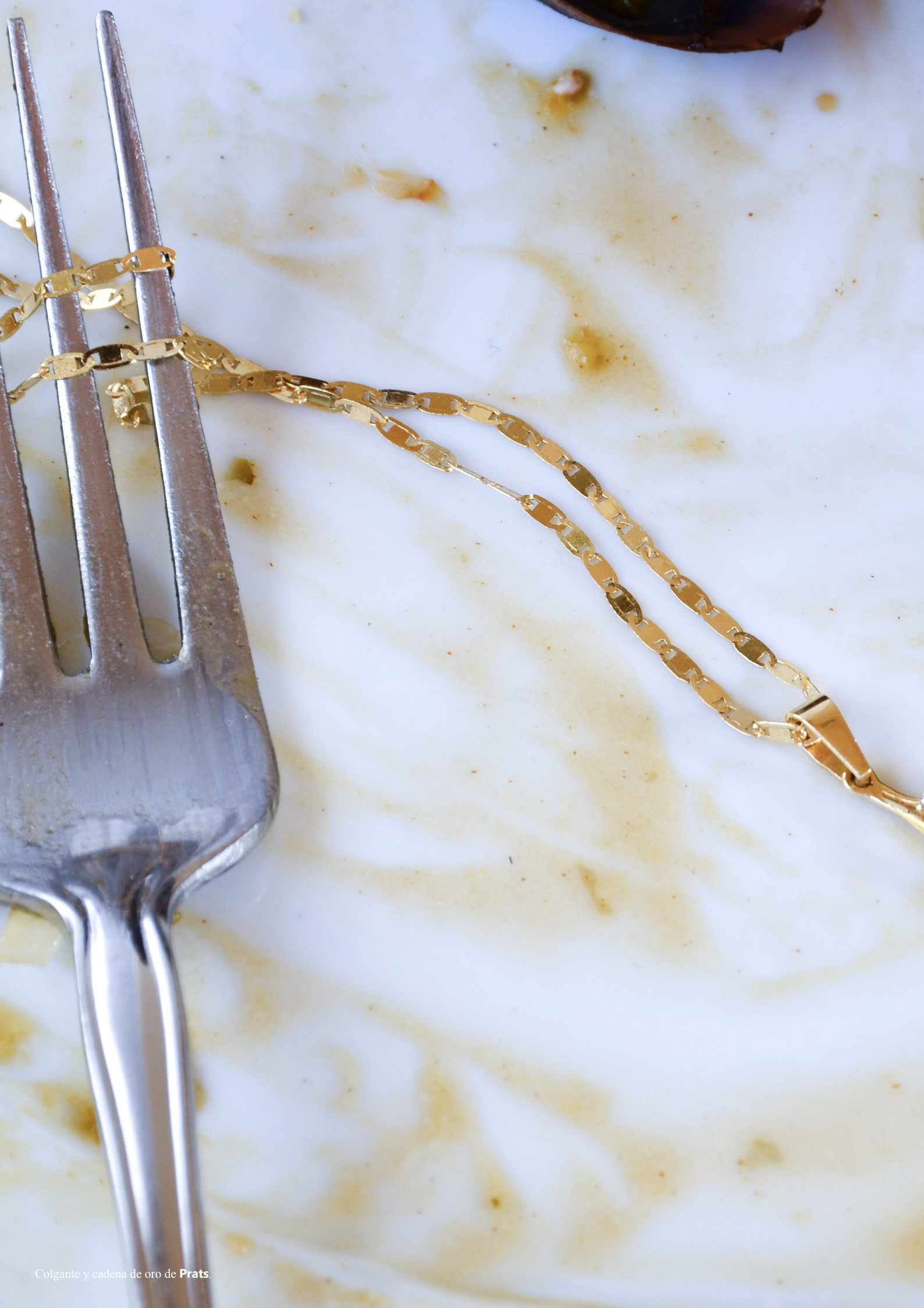
Colgante y cadena de oro de Prats.