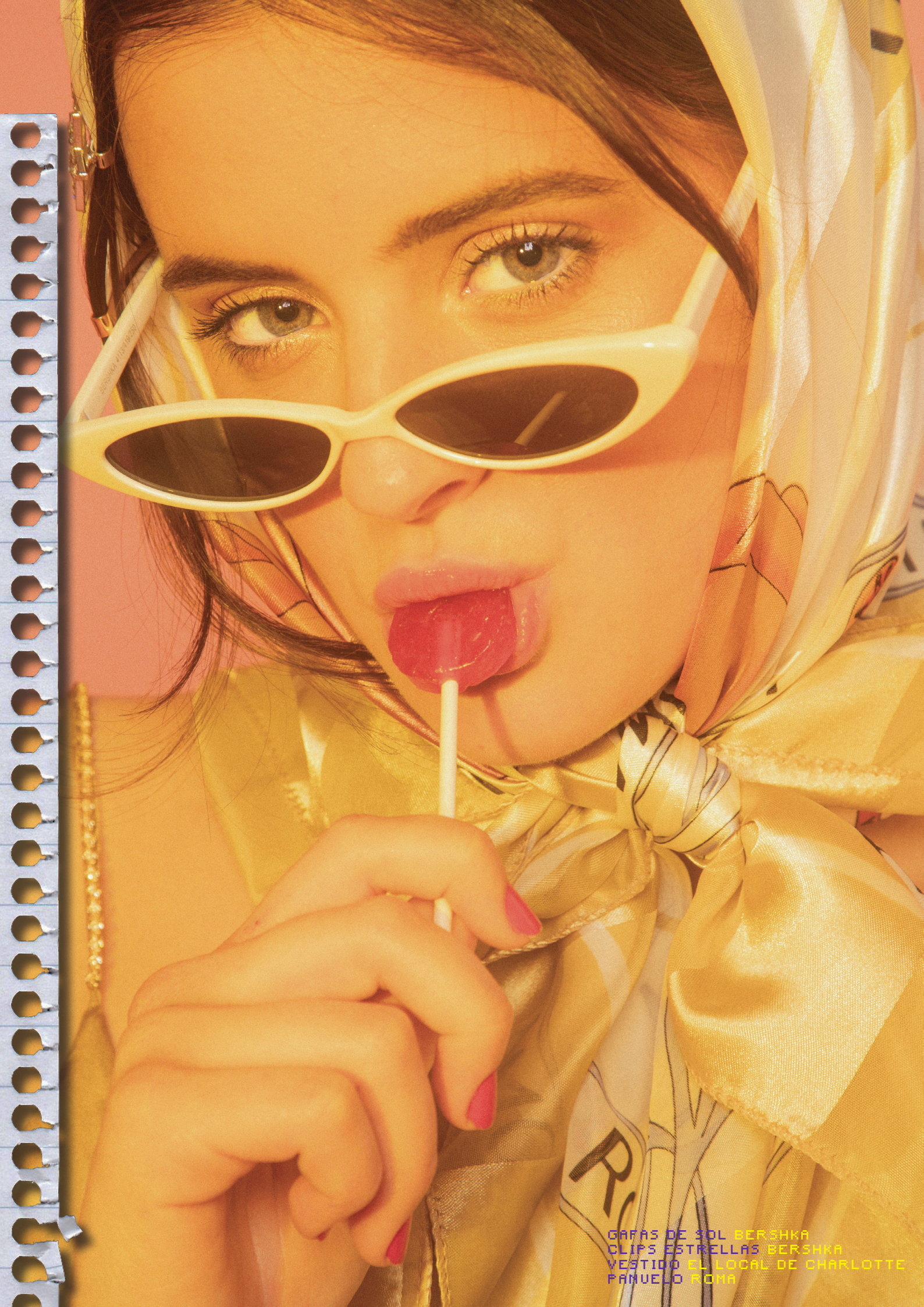
GAFFAS DE SOL BERSHKA CLIPS ESTRELLAS BERSHKA VESTIDO EL LOCAL DE CHARLOTTE PAÑUELO ROMA