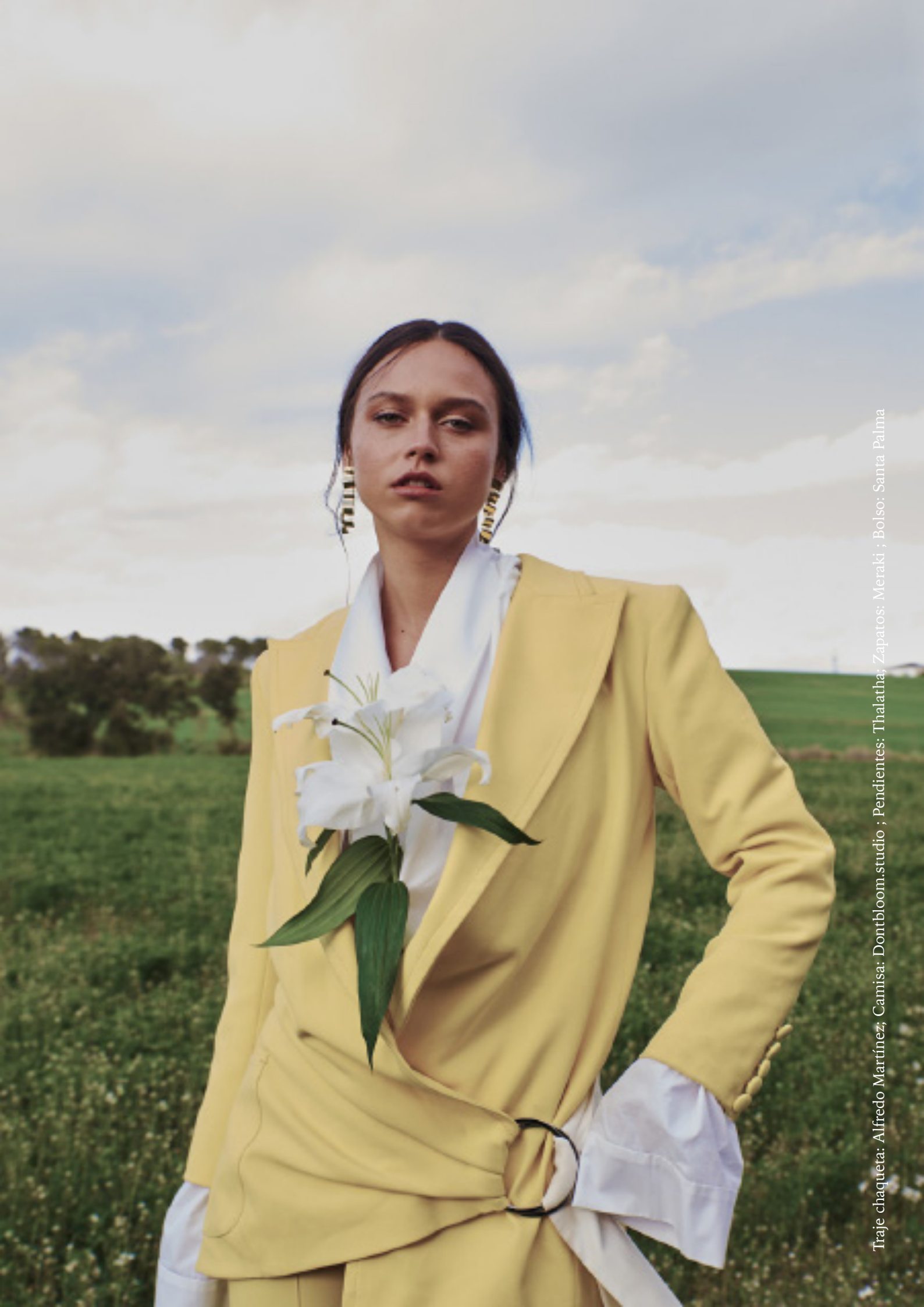
Traje chaqueta: Alfredo Martínez; Camisa: Dontbloom.studio ; Pendientes: Thalatha; Zapatos: Meraki ; Bolso: Santa Palma