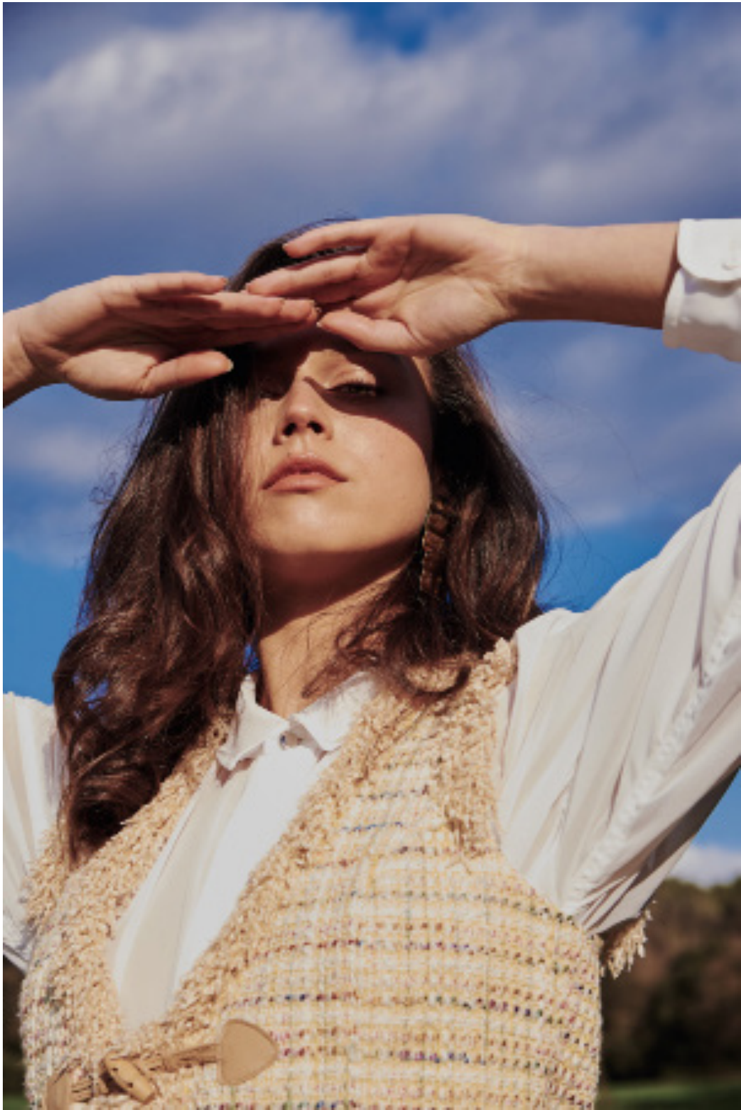
Chaleco: Kuzmovich Camisa: JNORIG Pendientes: Thalatha