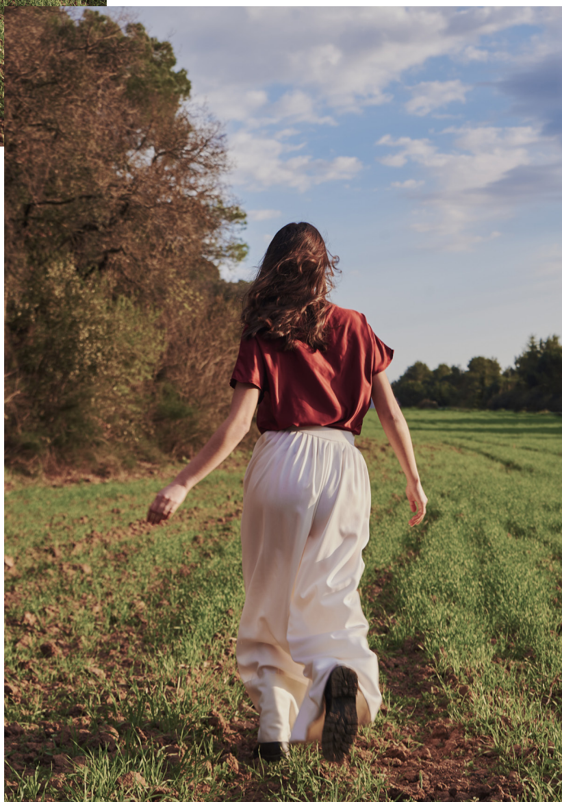
Camisa: Pablo Erroz Pantalones: dontbloom.studio Pendientes: PDPaola