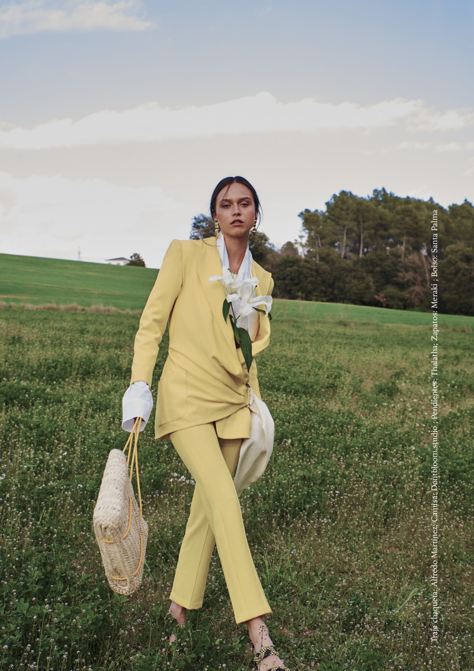
Traje chaqueta: Alfredo Martínez; Camisa: Dontbloom.studio ; Pendientes: Thalatha; Zapatos: Meraki ; Bolso: Santa Palma